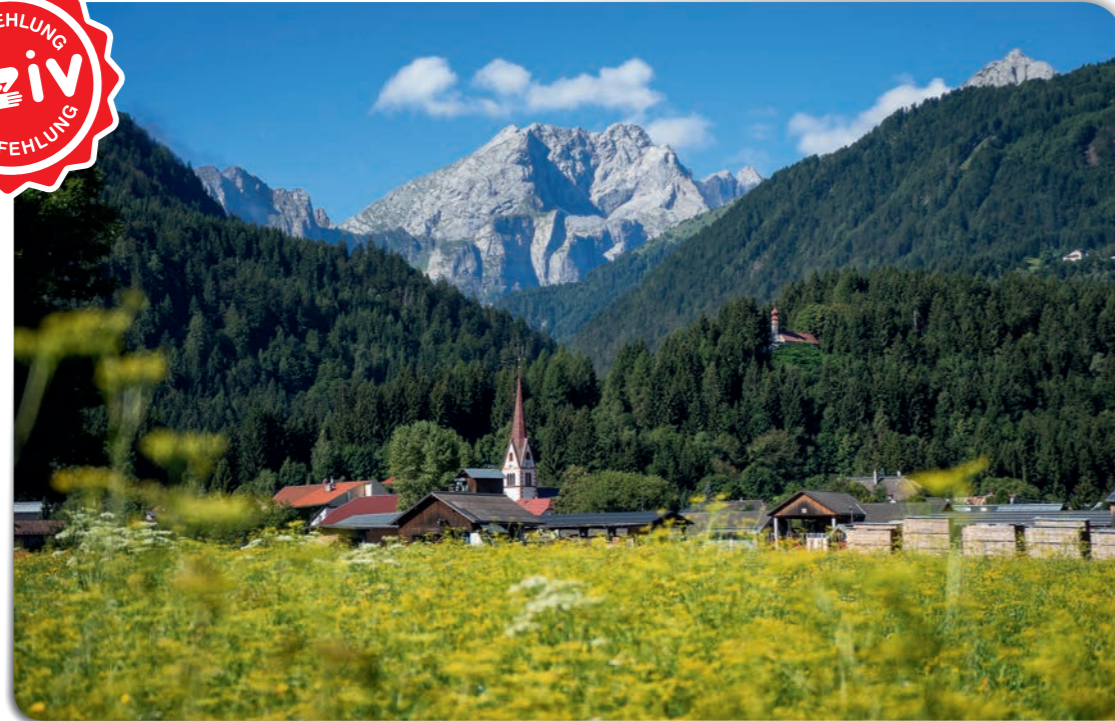
Guide/Betreuung: Gerlinde Krawanja- Ortner